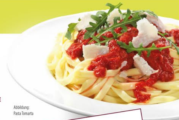
Abbildung: Pasta Tomarta

saisonale MUNDFEIN Salatmischung** mit orientalisch mariniertes Hähnchenbrust, Brotchips, Kirschtomaten, gebratenen Zwiebeln und Granatapfelsirup 1,3 ..... 12,45 €