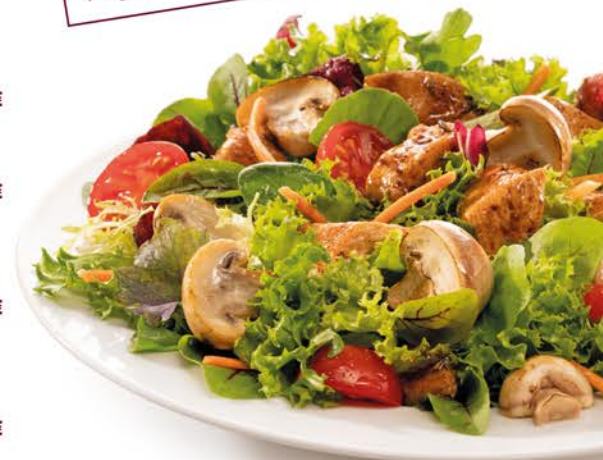
Abbildung: Salat Paris

Extras zu deinem Pastagericht mit extra Käse 6 überbacken ..... +1,00 € 3 Pizzabrötchen ..... +1,00 € z. B. Mozzarella-Käse 6 ..... +1,90 € ► Ergänze mit weiteren Zutaten (mundfein.de/extras)