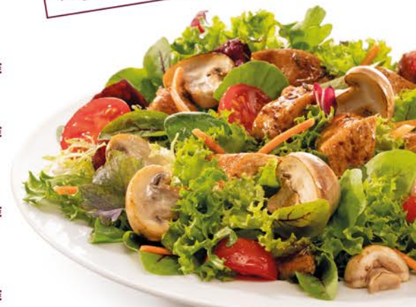
Abbildung: Salat Paris

Extras zu deinem Pastagericht mit extra Käse 6 überbacken ..... +1,00 € 3 Pizzabrötchen A,AG,P ..... +1,00 € z. B. Mozzarella-Käse 6 ..... +1,90 € ► Ergänze mit weiteren Zutaten (mundfein.de/extras)