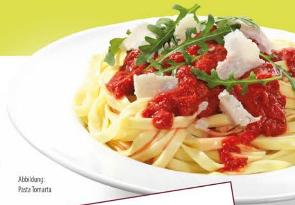
Abbildung: Pasta Tomarta

saisonale MUNDFEIN Salatmischung** mit orientalisch mariniertes Hähnchenbrust, Brotchips, Kirschtomaten, gebratenen Zwiebeln und Granatapfelsirup 1,3 ..... 13,45 €