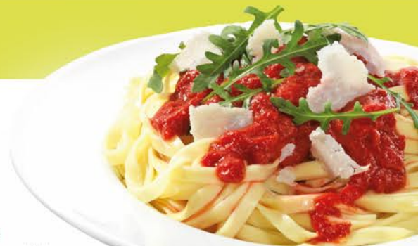
Abbildung: Pasta Tomarta

saisonale MUNDFEIN Salatmischung** mit orientalisch mariniertes Hähnchenbrust, Brotchips, Kirschtomaten, gebratenen Zwiebeln und Granatapfelsirup 1,3 ..... 13,95 €