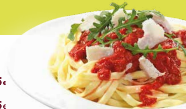
Abbildung: Pasta Tomarta

saisonale MUNDFEIN Salatmischung** mit Ziegenkäse und Honig, Cranberries und Mehrkornmischung ..... 13,45€