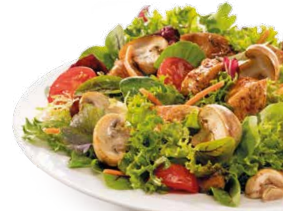
Abbildung: Salat Paris

Extras zu deinem Pastagericht mit extra Käse 6 überbacken ..... +1,60€ 3 Pizzabrötchen A,AG,P ..... +1,60€ z. B. Mozzarella-Käse 6 ..... +2,25€ ► Ergänze mit weiteren Zutaten (mundfein.de/extras)