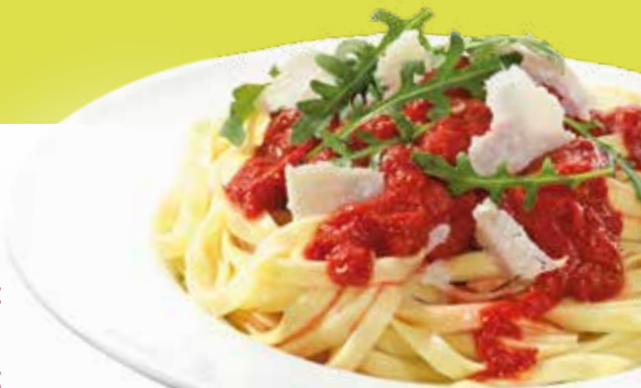
Abbildung: Pasta Tomarta

saisonale MUNDFEIN Salatmischung** mit Ziegenkäse und Honig, Cranberries und Mehrkornmischung ..... 12,95€