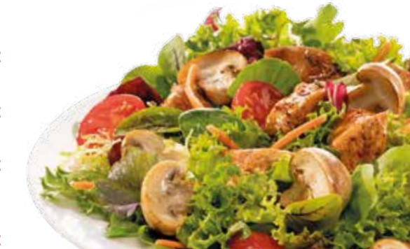
Abbildung: Salat Paris

Zu jedem Salat GRATIS – 3 Pizzabrötchen A,AG,P + ein Dressing nach Wahl: Helles Balsamico -M , Caesar -C,G,M , pikantes Haus -C,L,M,2,3 o. Joghurt -C,G,2,3 (mit Knoblauch) Dressing Extra Dressing ..... 1,90€ ► Ergänze mit weiteren Zutaten (mundfein.de/extras)