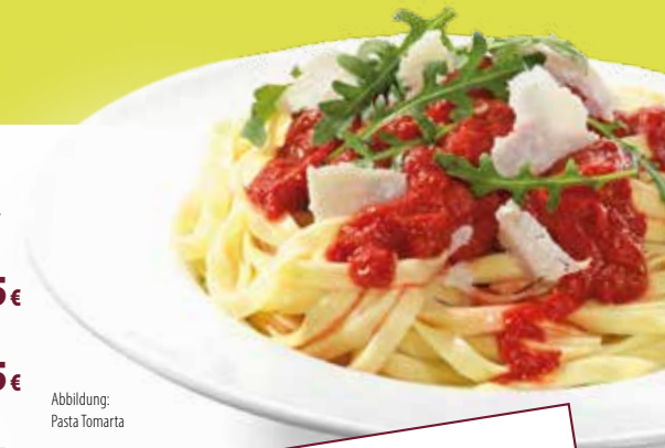
Abbildung: Pasta Tomarta

saisonale MUNDFEIN Salatmischung** mit Ziegenkäse und Honig, Cranberries und Mehrkornmischung ..... 13,45€