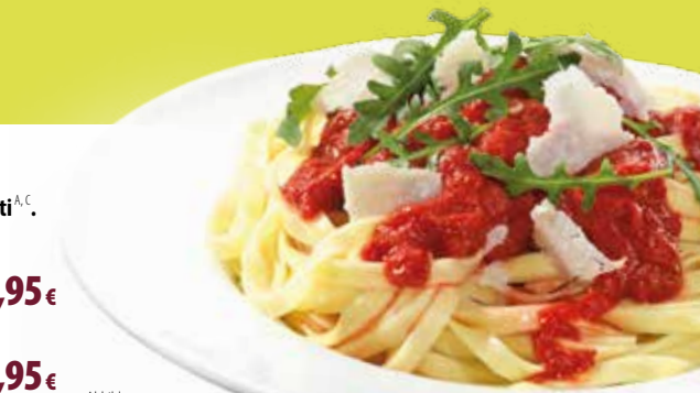
Abbildung: Pasta Tomarta

saisonale MUNDFEIN Salatmischung** mit Ziegenkäse und Honig, Cranberries und Mehrkornmischung ..... 13,95€