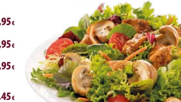
Abbildung: Salat Paris