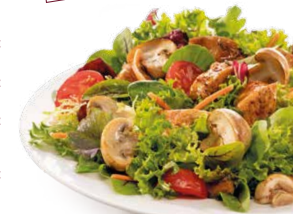
Abbildung: Salat Paris